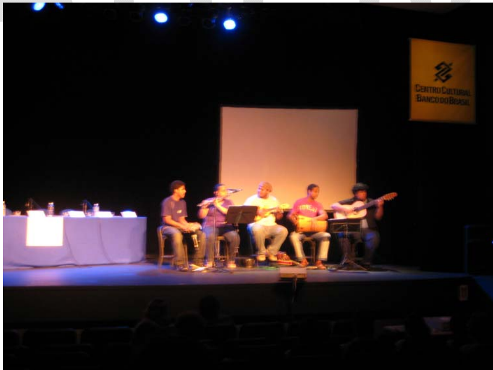
Grupo Chorando à Toa